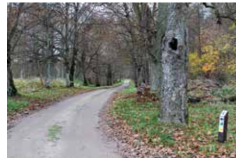
Šereiklaukio miško takas

Šereiklaukio miško apžvalgos bokštas pastatytas vienoje iš didžiausių Šereiklaukio miško pievų gamtos stebėjimui ir gamtinio kraštovaizdžio apžvalgai. Žvelgiant nuo jo į rytus atsiveria puikus vaizdas į natūralią terasuotame reljefe plytinčią pievą. Tolumoje matyti Šereiklaukio dvaro spirito varyklos kaminas, o kiek dešiniau skaidrią dieną galima aiškiai matyti vietą, kur susilieja Šešupė ir Nemunas. Ši apžvalgos vieta yra Šereiklaukio miško take.