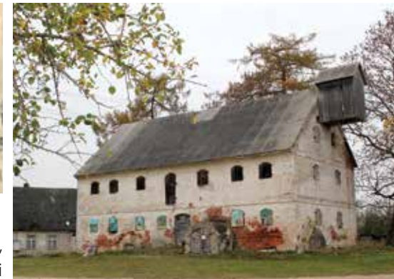
Šereiklaukio dvaro svirnas