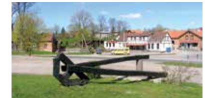
Paminklas zalcburgiečiams atminti