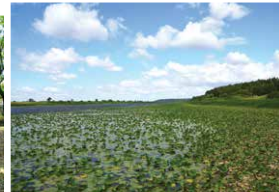
Panorama nuo apžvalgos bokšto prie Merguvos ežero