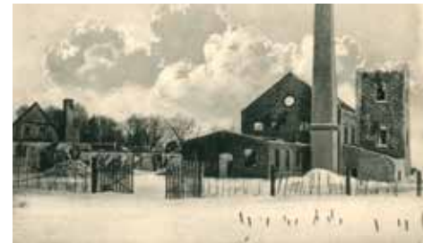
Šereiklaukio dvaro sodyba po I pasaulinio karo

Stebėti gamtą ir grožėtis kraštovaizdžiu siūlome žygiuojant Šereiklaukio girioje įrengtu žiediniu pėsčiųjų miško taku. Takas prasideda ties kelių išsišakojimu Šereiklaukio kaime. Čia įrengtas pradžia ir pabaiga žymintis, taką apibūdinantis informacinis stendas. Tai ne vienas, o net trys skirtingo ilgio takai, kurie prasideda ir baigiasi tame pačiame taške. Simboliškai jie pavadinti geltonąja, žaliaja ir mėlynąja trasomis, kurių ilgiai atitinkamai 1,5 km, 5,5 km ir 9 km. Visos trasos pažymėtos specialiais ženklais, padedančiais nepasiklysti. Dirbtinių dangų take nėra. Keliose vietose takas eina tiesiog mišku, o trasa pažymėta juostelėmis ant medžių, tad reikia būti atidiems norint neišklysti iš tako. Perėjimui per šlapias vietas 2 tako atkarpose įrengti liepteliai. Keliaudami žaliaja trasa pasieksite vietą, kur buvo Dalnico palivarkas, priklausęs Šereiklaukio dvarui. Apie čia buvusią stambaus ūkio sodybą mena