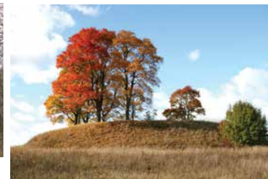
Šereiklaukio II piliakalnis (Milžinkapis)