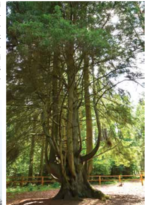
Gamtos paminklas „Raganų eglė“