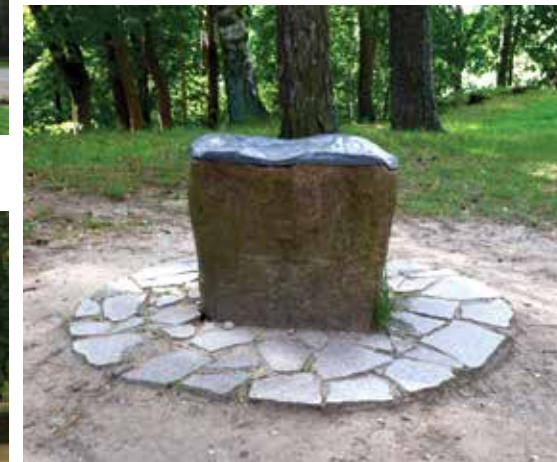
Istorinis akmuo ant Rambyno kalno