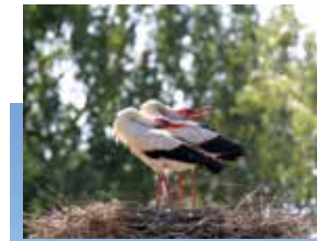
Baltųjų gandrų kolonija Bitėnuose