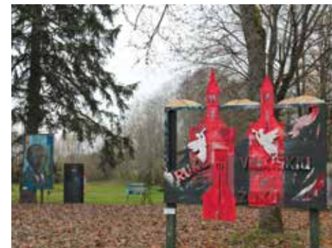
Mažosios Lietuvos paveikslų sodas prie M. Jankaus muziejaus