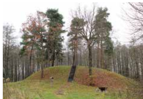
Opstainių II piliakalnis