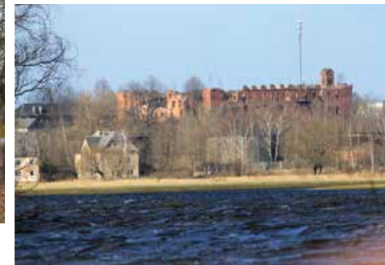
Ragainės pilies vaizdas kitapus Nemuno nuo apžvalgos bokšto prie Merguvos ežero