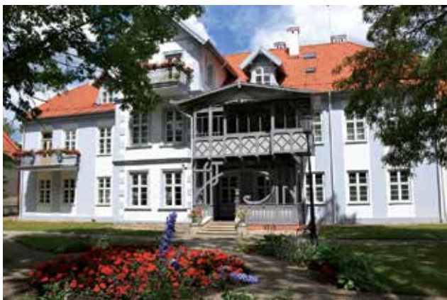
Hugo Šojaus dvaras – muziejus Šilutėje.

sukūrė kolūkius. Dvarus su visais pastatais, inventoriu, kurdami kolūkius, skubiai naikino. Dvarų pastatuose buvo apgyvendinta daug šeimų, atvykusių iš kitų Lietuvos ar slaviškų kraštų. Kai kurie pas-