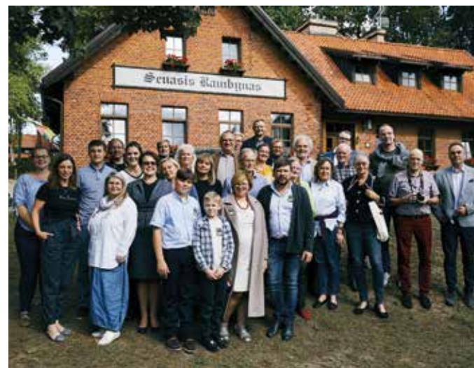
Projekto „Pietų Baltijos dvarai“ partnerių susitikimas Rambynos regioniniame parke, 2019 m. rugsėjis

Remiami projektai, tobulinantys aplinkosauginių pavojų valdymą regione. Remiamas bendradarbiavimas tarp žmonių, siekiant naudoti gamtos, kultūros ir socialinius išteklius regiono pripažinimui Europoje ir pasaulyje.