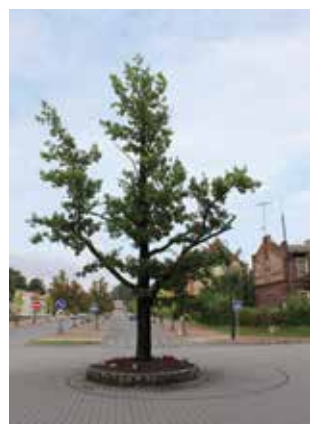
„Vilniaus ažuolas“ Pagėgiuose, 2018

važiuosite per Pagėgių miestelį, garsėjantį gausa puošnios architektūros pastatų, statytų tarpukariu, bei galėsite pamatyti 1924 m. prie senosios geležinkelio stoties pasodintą „Vilniaus ažuolą“.