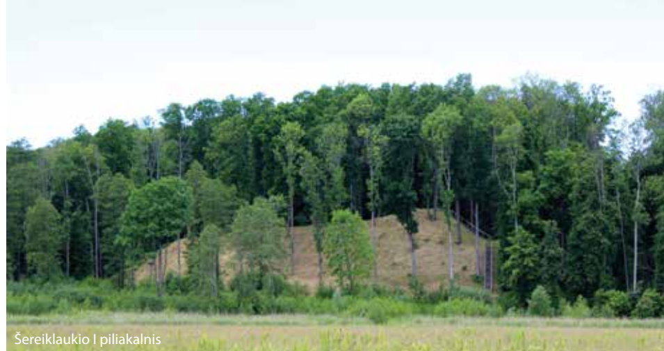
Šereiklaukio I piliakalnis

Prie nedidelio Opstainių kaime esančio tvenkinio prisiglaudęs Opstainių II piliakalnis. Tvenkinys įrengtas tik sovietmečiu, užtvenkus Apstelės upeliuką, kuris juosia piliakalnio kalvą. Piliakalnis nedidelis, šlaitai statūs, nulyginti, bet gynybinių įtvirtinimų nebėra. Greta piliakalnio rastos negausios grublėtos keramikos šukės liudija, kad tai senesnio laikotarpio piliakalnis. Greta piliakalnio – beveik 37 m aukščio išraiškinga kalva, nuo kurios atsiveria puikūs apylinkių vaizdai. Birželio mėnesį kalva nusidažo raudonai, nes čia gausiai pražysta retas Lietuvoje augalas – paprastoji smaliukė.