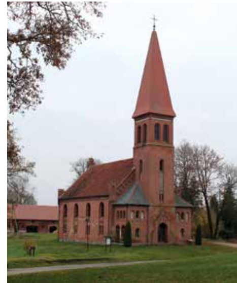
Vilkyškių evangelikų liuteronų bažnyčia

susipynę, kai kurie net jaugę vienas į kitą tarsi susivėlę raganos plaukai. Medis apipintas legendomis. Tai bene vienintelė tokios įspūdingos, neįprastos formos paprastoji eglė ne tik Lietuvoje, bet ir Europoje arba visame šių medžių savaiminio paplitimo areale. Lankymui įrengtas patogus priėjimo takas ir apžvalgos vieta. Medis aptvertas saugant jį nuo nepageidaujamo šaknų mindžiojimo polajyje.