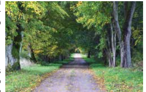
Šereiklaukio dvaro alėja, vedanti į Kopolyčkalnį