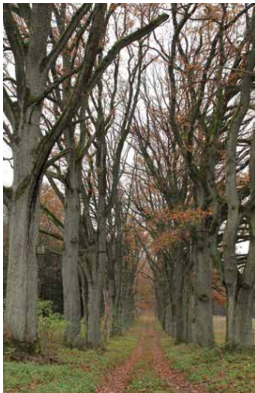
Gamtos paveldo objektas „Vilkyškių ažuolų alėja“

Vilkyškių miestelio centrinės dalies pakraštyje stovi paminklas I pasauliniame kare žuvusiems parapijos vyrams atminti. Paminklas pastatytas 1920 metais. Jo nišose buvusios granito plokštės su žuvusiųjų pavardėmis sovietmečiu sudaužytos. 2002 m. paminklas restauruotas, bet žuvusiųjų pavardės nebuvo nustatytos. Ant paminklo užrašas: „Karuose, tremtyje ir toli nuo Tėvynės žuvusiųjų atminimui. Vilkyškių bažnyčios bendruomenė“.