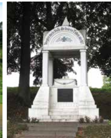
Paminklas I pasauliniame kare žuvusiems vilkyškietims