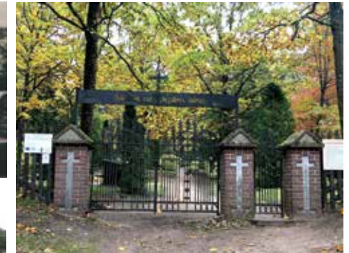
Bitėnų – Užbičių kapinės – Mažosios Lietuvos panteonas