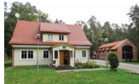
Rambyno regioninio parko lankytojų centras istorinėje G. Volbergo sodyboje