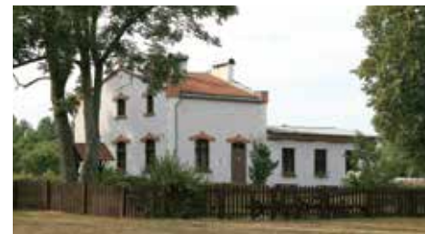
Martyno Jankaus muziejus Bitėnuose