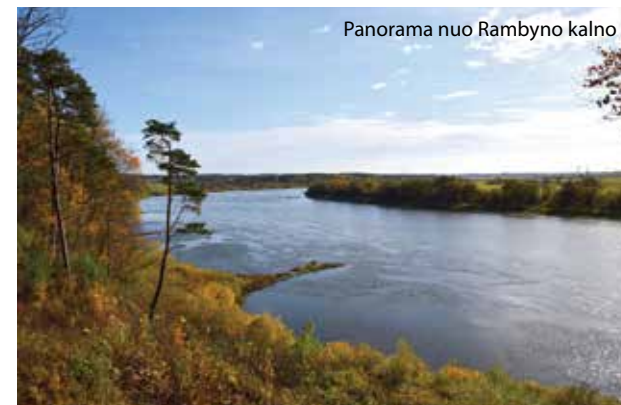
Panorama nuo Rambyno kalno

Siekiant užtikrinti gamtos ir kultūros paveldo vertybių apsaugą Rambyno regioniniame parke 2001 metų sausio 1 dieną įsteigta Rambyno regioninio parko direkcija.