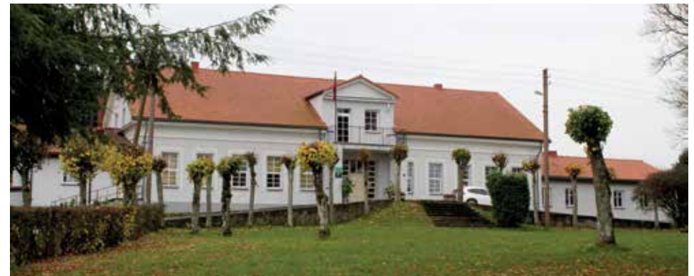
Restauruoti Vilkyškių dvaro rūmai