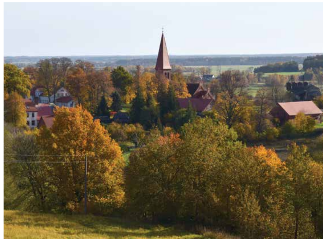
Panorama nuo Vilkyškių apžvalgos bokšto