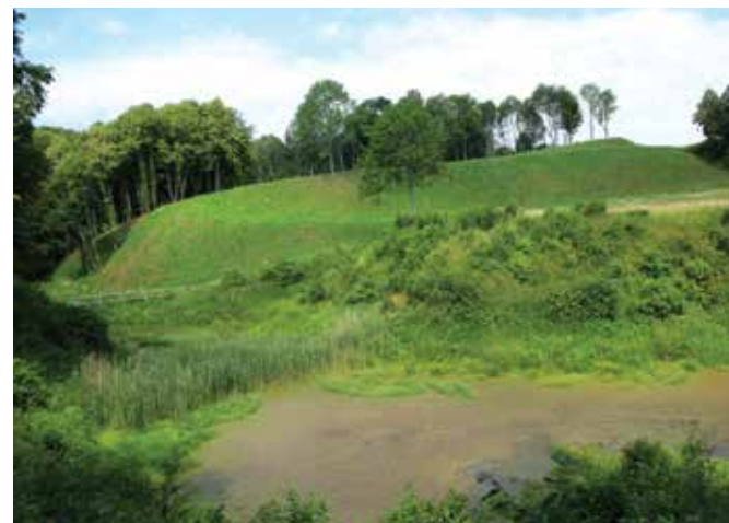
Opstainių (Vilkyškių) I piliakalnis