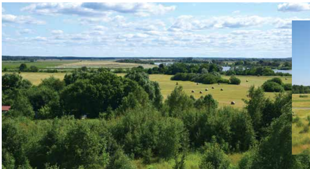
Panorama nuo apžvalgos bokšto Šereiklaukio kaime