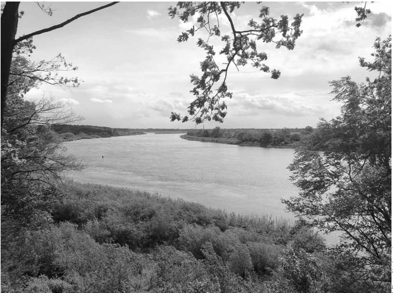
Nemuno ir Merguvos santaka