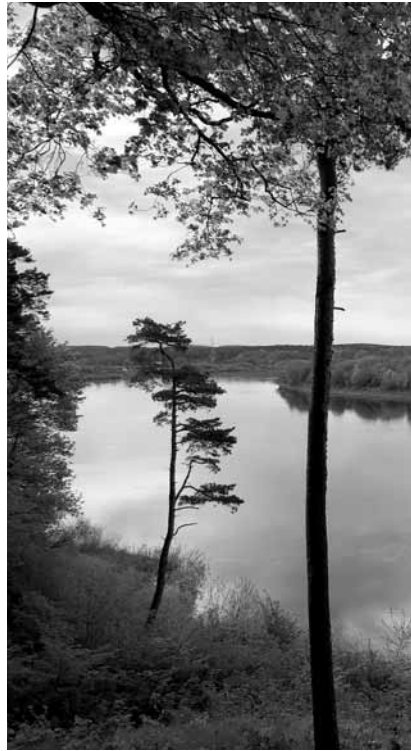
Nemuno vingis ties Bitėnais

Rambyno kalno papėdėje, dešiniajame Nemuno krante, įsikūręs Bitėnų kaimas, kadaise priklausęs Ragainės parapijai. Žinios apie šį kaimą siekia net XVI a. vidurį. Bitėniškiams Nemunas buvo ypač svarbus. Šis kaimas nuo seno buvo Ragainės priemiestis,