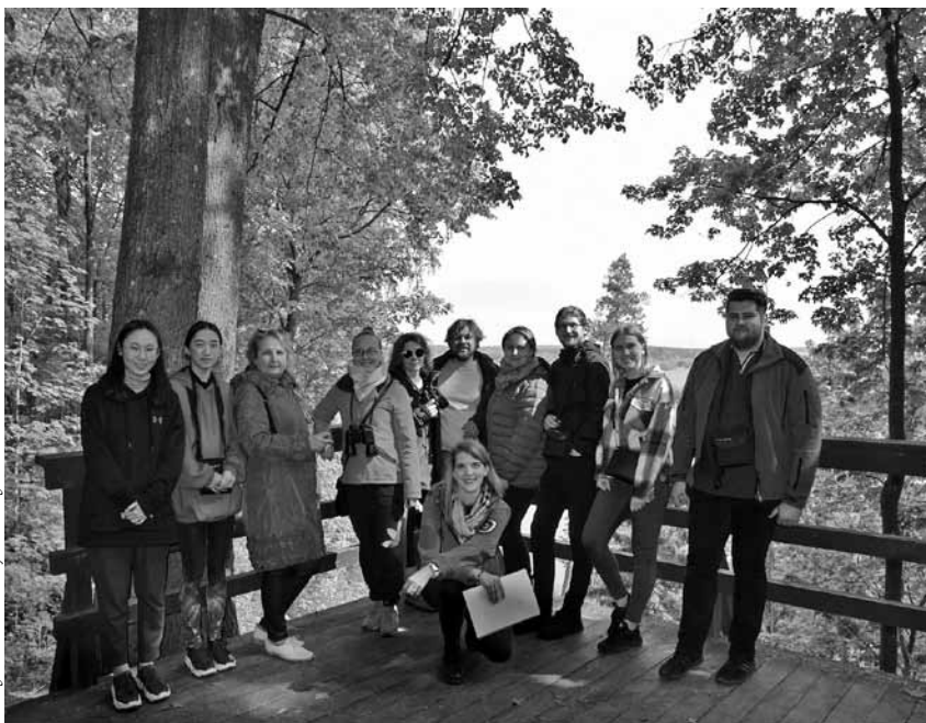
Gidų kursų dalyviai

Džiaugiuosi turėdama tokią galimybę – ne tik įgyti naujų žinių apie kitus Lietuvos miestus ir miestelius, bet ir būti tuo žmogumi, kuris apie Rambyno regioninio parko vertybes, istoriją, įdomybes gali papasakoti ir čia atvykstantiems žmonėms.