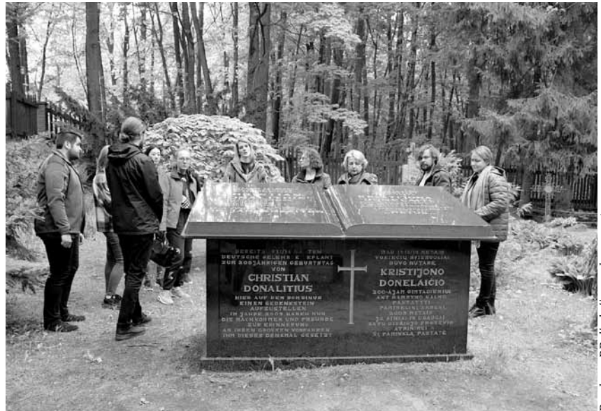
Bitėnų kapinaitėse prie kenotafo K. Donelaičiui

Gidų kursai – intensyvūs. Jų metu gauname labai daug teorinių žinių, o dalyvaudami ir patys vesdami ekskursijas mokomės jas pritaikyti praktikoje. Kolegų ekskursijų jau klausėme Vilniuje, Alytuje, Druskininkuose. O gegužės 22 dieną visa naujų gidų grupė lankėsi Ramby-